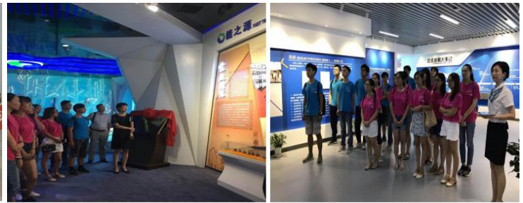
济南大学商学院 CIMA 会计创新实验班同学参观实习山东能源集团，山东高速集团