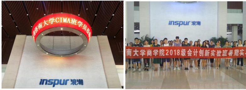
济南大学商学院 CIMA 会计创新实验班同学参观实习浪潮集团